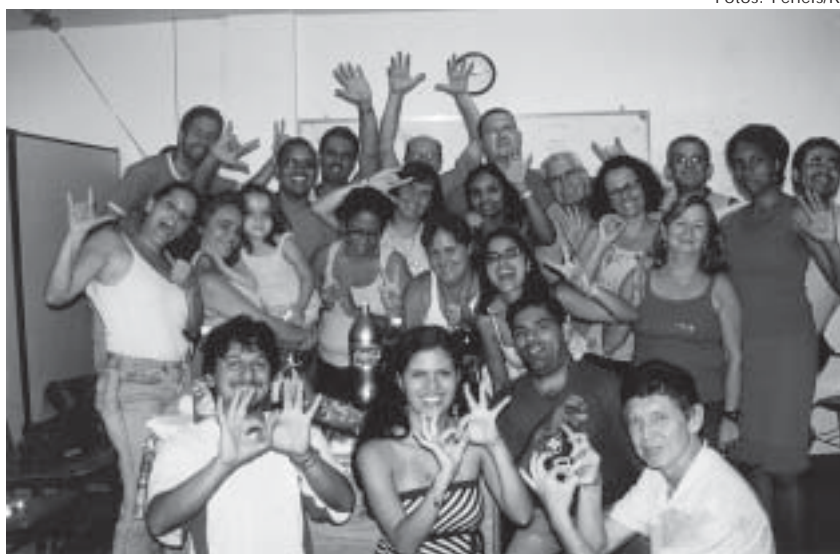
O grupo que participou do curso em 2006

Diante das problemáticas que envolvem os objetivos pedagógicos e lingüísticos voltados para a pessoa surda, surgiu a proposta de oferecer ao Surdo, a partir do português instrumental, uma atividade complementar para enriquecer seu vocabulário. Além disso, a iniciativa visa ao desenvolvimento da imaginação criadora, estimulação da leitura, experiências com informativos, jornais e revistas através programações dinâmicas e inovadoras. A iniciativa de criação do Curso livre de Português da Feneis, que em todos esses anos tem buscado desempenhar projetos de cidadania e ações sociais, reforça mais uma vez a sua preocupação com a inclusão da pessoa Surda.