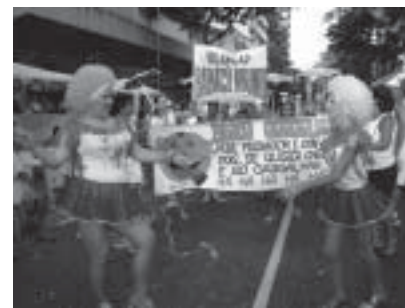
Intérprete ajudou a integrar surdo no bloco