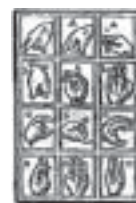
(Gravura de madeira extraída da obra de Cosmas Rosselius "Theasaurus", 1579)

Outra representação mais antiga do Alfabeto Manual é o da figura abaixo, da Veneza, Itália, ano 1579. Observemos a evolução da reprodução da imagem pela posição das letras em três maneiras.