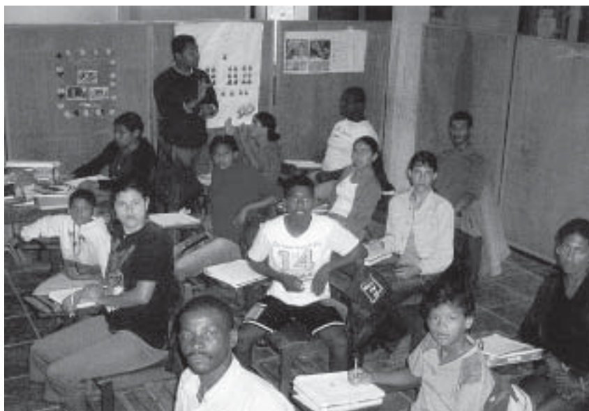
Sala de aula com os alunos surdos do Apem