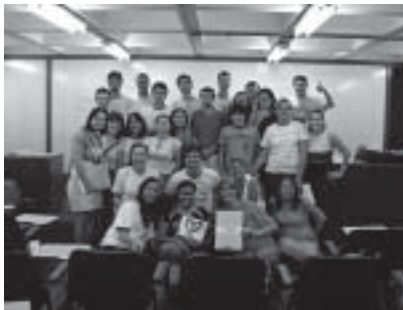
Participantes animados com o resultado do evento

Participantes debatem sobre informática e Libras no Rio Grande do Sul