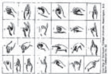
The chart above is one of the earliest French hand alphabet charts, introduced in 1802 at the National School of Deaf-Mutes in Paris (1802).

O alfabeto usado no Brasil é originado do alfabeto manual Francês, se observarmos bem, poderemos perceber algumas semelhanças entre eles.