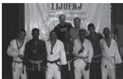
Grupo do projeto "Valorizando as Diferenças"

em Botafogo, zona sul do Rio. O professor explica que seus alunos surdos possuem uma concentração e uma percepção visual muito mais aguçada que os demais e lembra do quanto é recompensador, apesar das barreiras da comunicação, vê-los assimilando conceitos e evoluindo a cada dia.