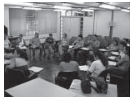
A iniciativa promovida pela Feneis-RS reuniu estudantes e profissionais da área de informática, além de intérpretes

A legislação que garante os direitos básicos de acesso à educação em qualquer nível de ensino via Libras tem sido um combustível para profissionais surdos e ouvintes que, de forma articulada, buscam fortalecer a Língua de Sinais e a cultura surda, constituindo grupos atuantes. Esses grupos também lutam para o desenvolvimento de projetos de atualização, pesquisa e inovação. Neste sentido, este ano ha-