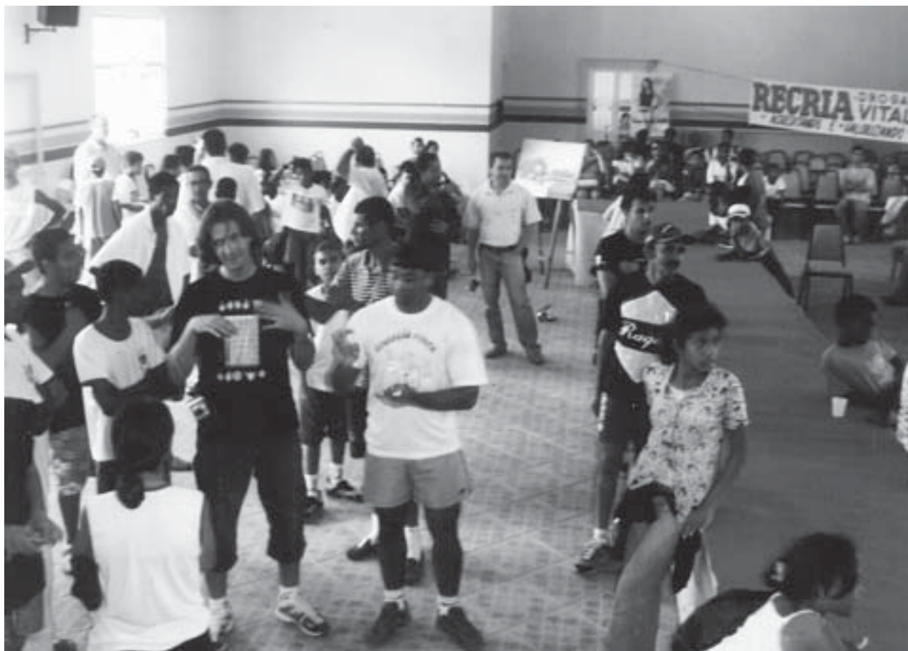
Projeto Aprender e Ensinar com as Mãos foi abraçado pela Secretaria de Educação de Nova Viçosa

Na Bahia, Projeto APEM completará quatro anos