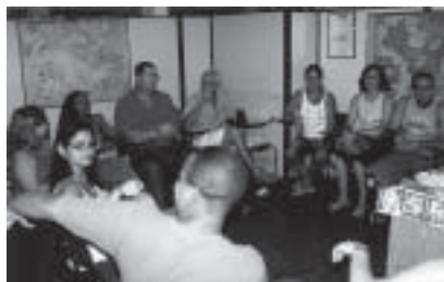
Dinâmica em sala de aula