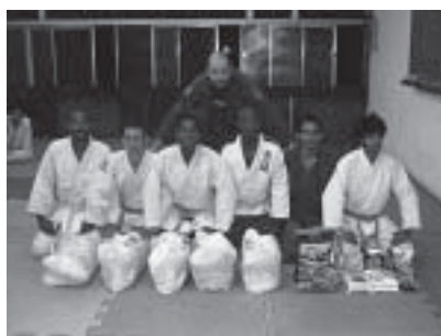
Equipe de judô

Funcionando há dois anos, o projeto já conta com 20 alunos com idades a partir de 15 anos. As aulas, gratuitas, acontecem três vezes na semana em uma sala do colégio Princesa Isabel,