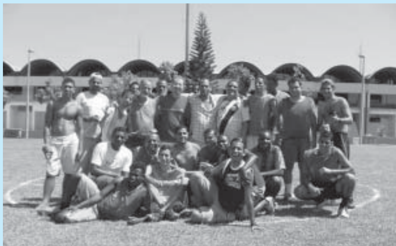
Surdos descontraídos durante o evento de final de ano organizado pelo DIREH

Foi dentro desse mesmo espírito e com o objetivo de sociabilizar que, no final do ano passado, foi organizado