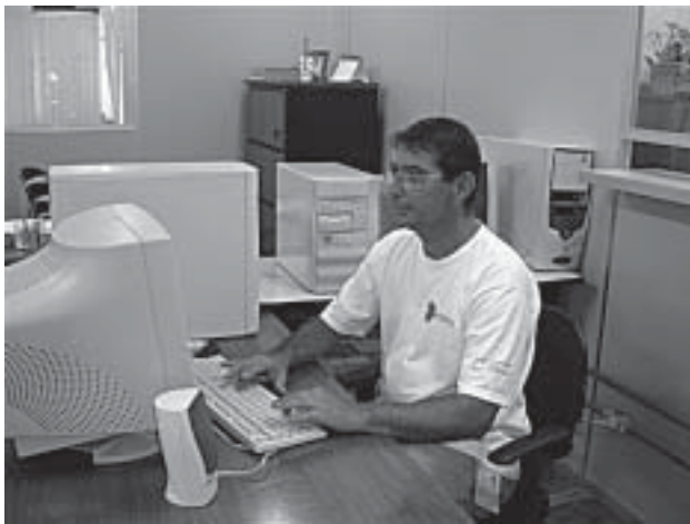
Surdos apresentam bom desempenho e resultados nas mais diversas frentes de trabalho