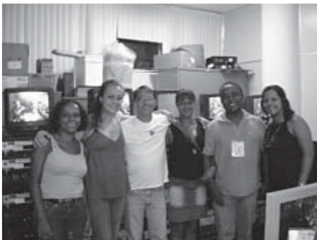
Surdos e ouvintes integrados em ambiente de trabalho