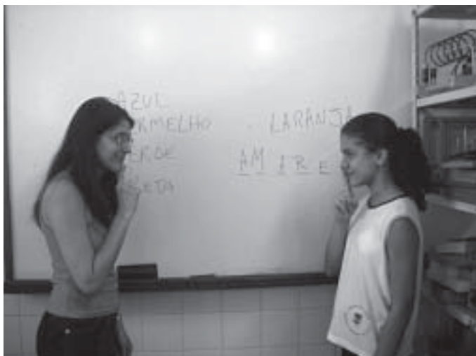
Aulas com ajuda de intérprete após muita negociação

Esta nova ferramenta de comunicação descortinou uma nova realidade: o fim da limitação imposta pela impossibilidade de comunicação.