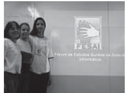
A logomarca do Evento que aconteceu pelo terceiro ano consecutivo

Com o objetivo de promover pesquisas buscando atualizar conhecimentos e debater a inclusão digital para Surdos na área de Informática, por meio da comunicação em Libras, o III Fórum de Estudos Surdos na Área de Informática (Fesai) foi realizado no Rio Grande do Sul. A iniciativa promovida pela Federação Nacional de Educação e Integração de Surdos (Feneis), com apoio do Serviço Nacional de Aprendizagem Comercial (Senac/RS), ocorreu no final do ano passado, reunindo aproximadamente 40 pessoas, entre elas profissionais, estudantes surdos e intérpretes.